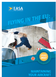
Flying in the EU: Maintenance