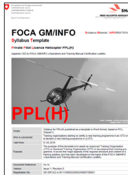
Syllabus Template PPL(H)