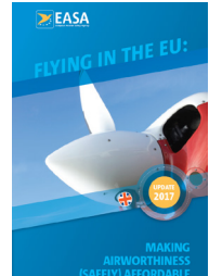
Flying in the EU: GA Airworthiness