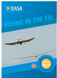
Flying in the EU: Ops is in the air