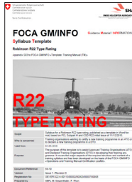
Syllabus Template R22 Type Rating