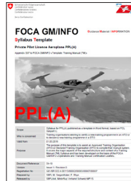
Syllabus Template PPL(A)