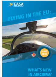
Flying in the EU: What's new in aircrew?