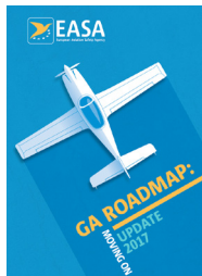
EASA GA Roadmap (Update 2017)