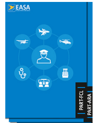
EASA Easy Access Rules